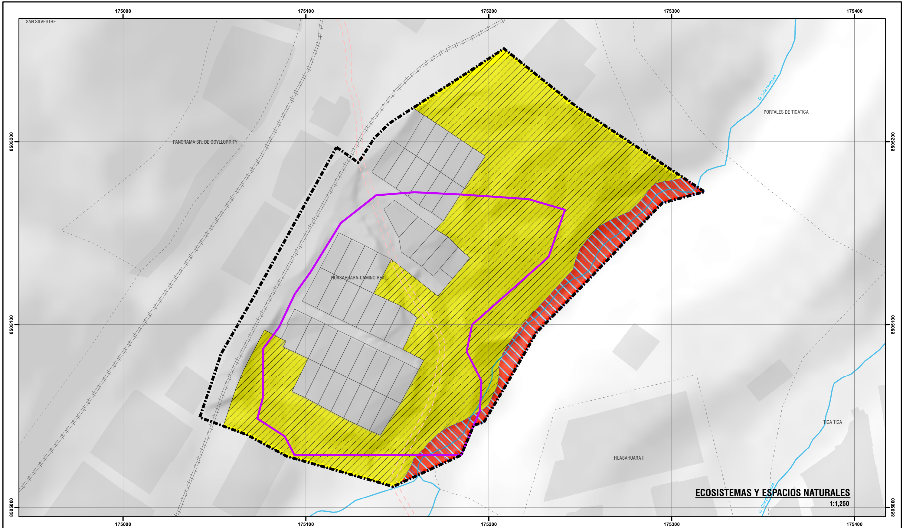
ECOSISTEMAS Y ESPACIOS NATURALES 1:1,250